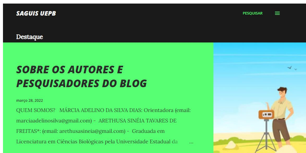
Figura 2 – Informações sobre os autores