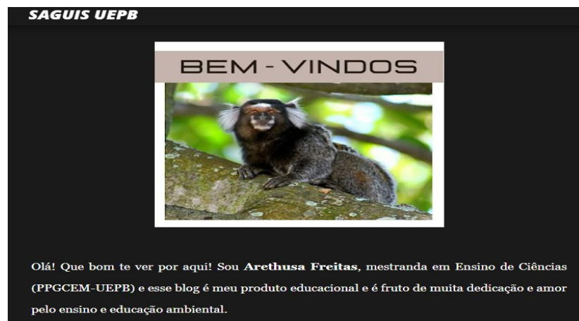
Figura 1 – Boas Vindas /