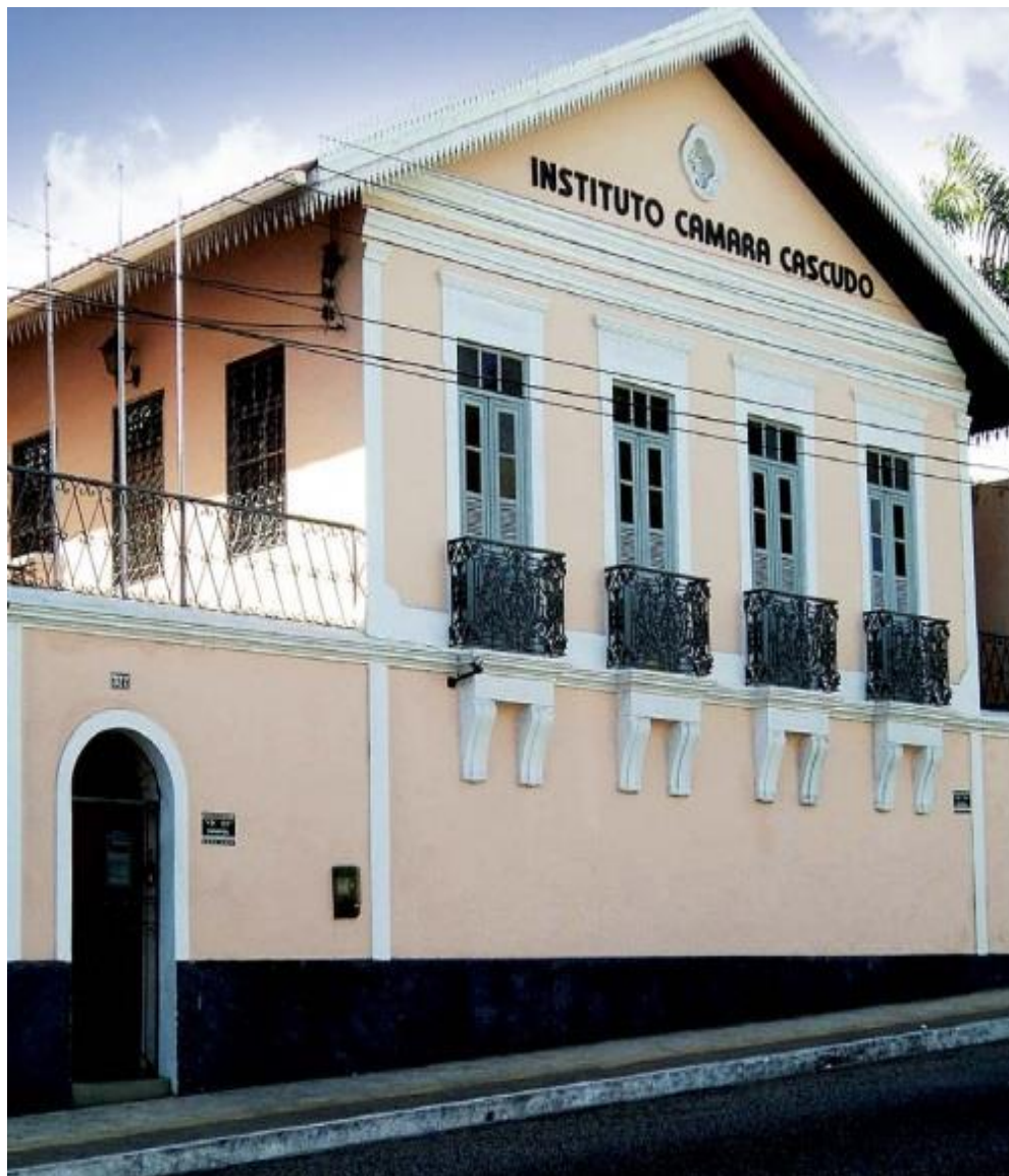
Residência de Luís da Câmara Cascudo – tombada pela Fundação José Augusto em 17/02/1990 – Atualmente – Ludovicus - Instituto Câmara Cascudo – Av. Câmara Cascudo – 377 – Bairro Cidade Alta – Natal -RN Crédito da imagem – Costa Amaral

In: https://www.ipatrimonio.org/natal-residencia-de-luis-camara-cascudo/#!/map=38329&loc=-5.78176244586661,-35.206209726621054,17