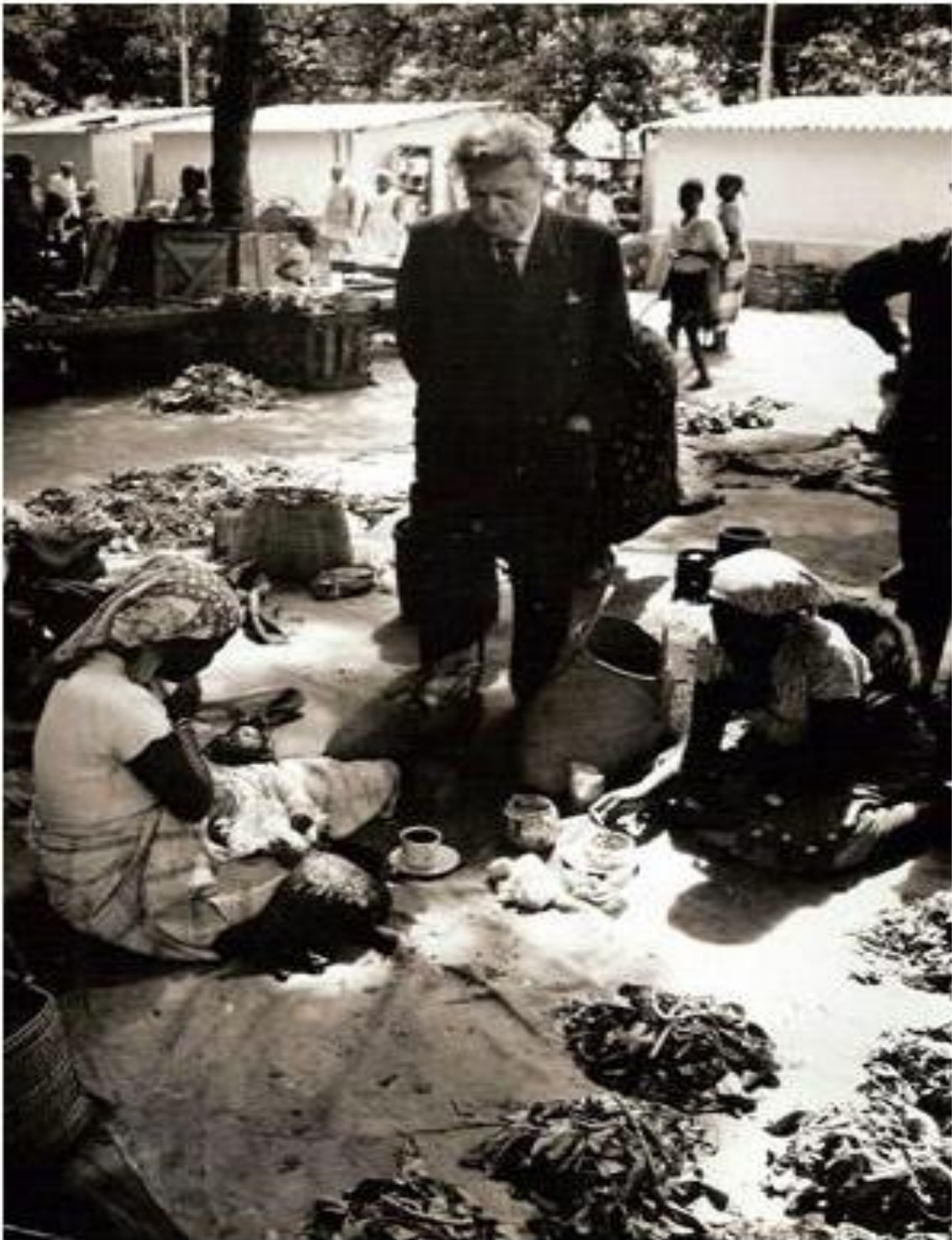
Câmara Cascudo em sua viagem a África, 1963