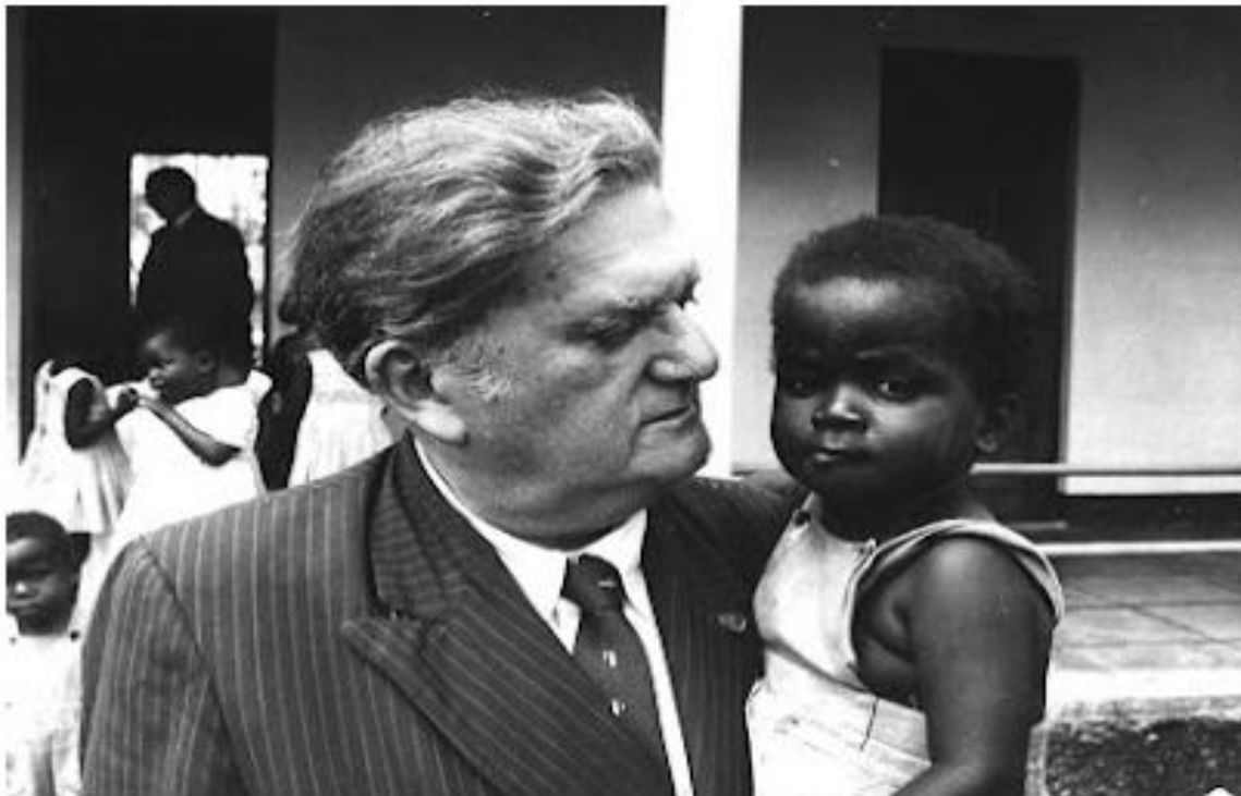
Câmara Cascudo viagem a África.