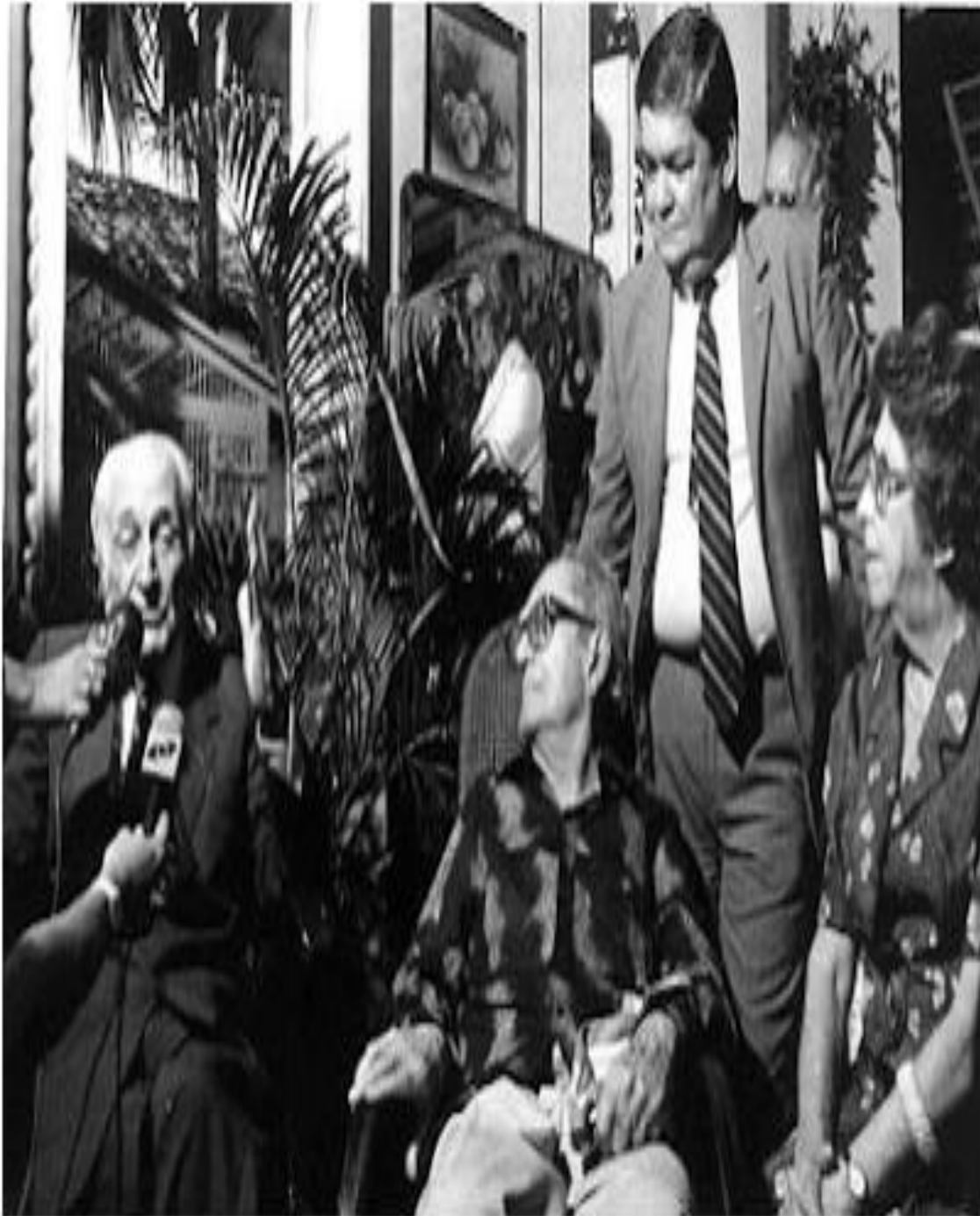
Visita de Gilberto Freyre a Câmara Cascudo, em 1984