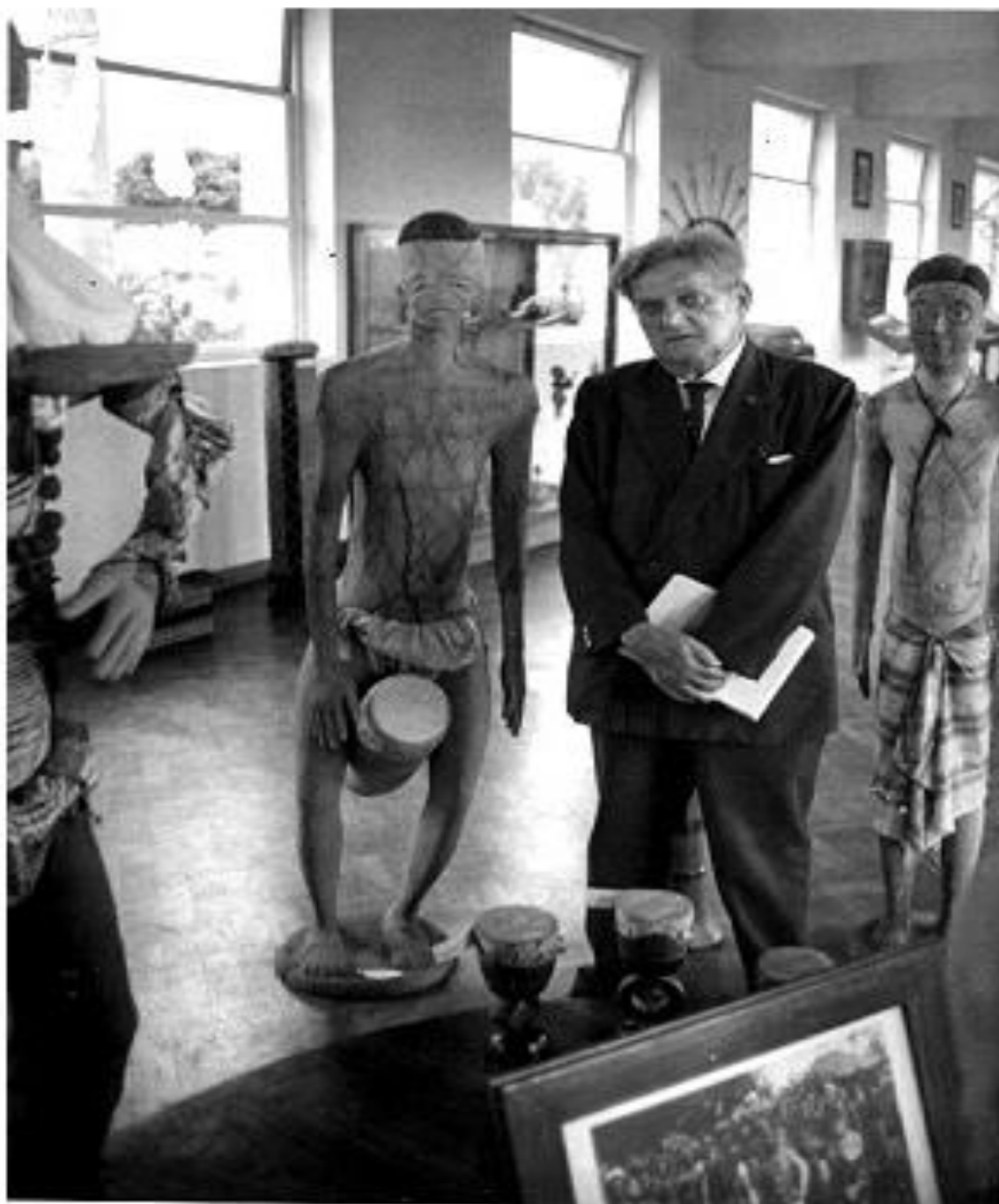
Cascudo no Museu de Nampula, em Moçambique Julho de 1963.