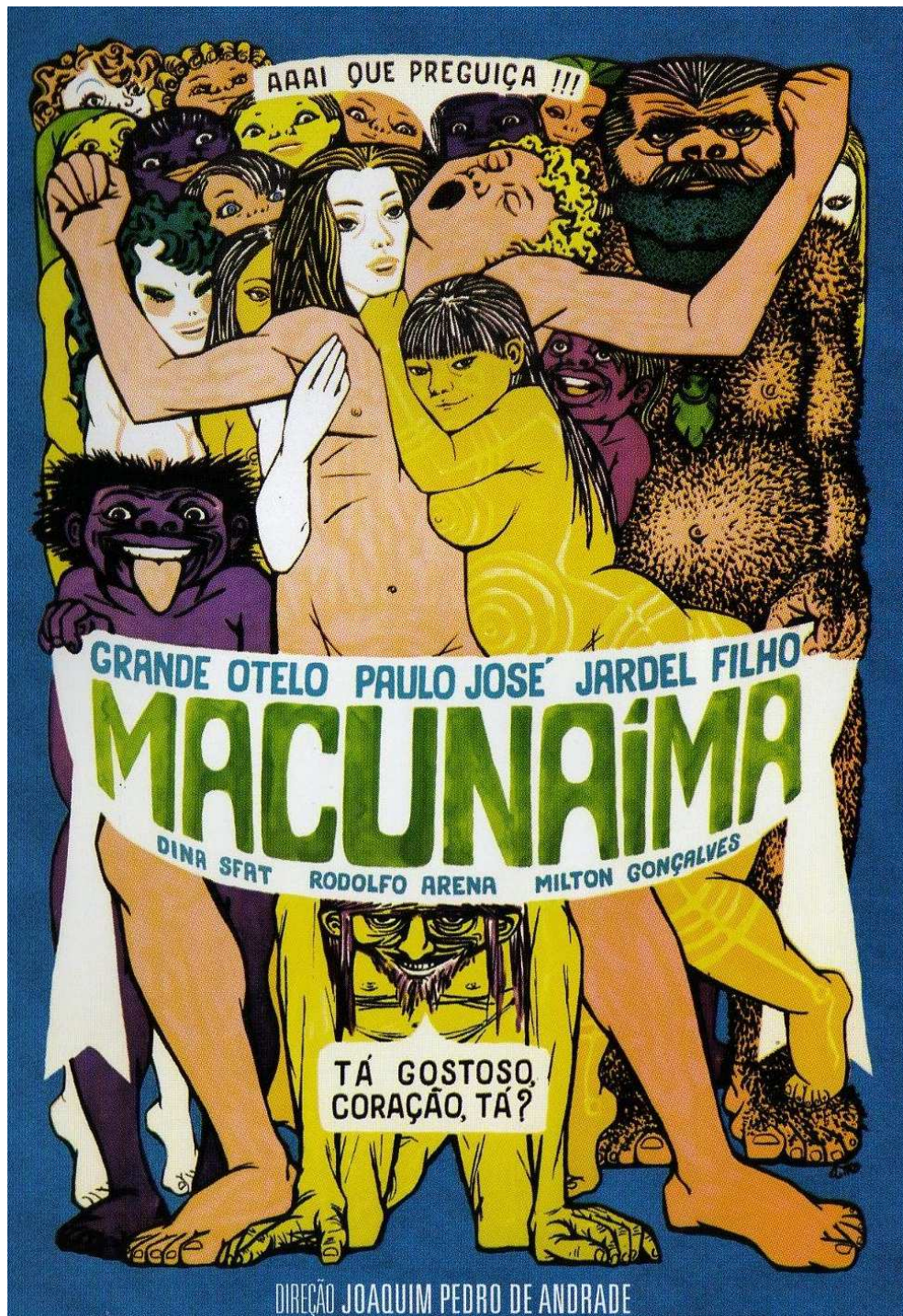
Cartaz do filme de Joaquim Pedro de Andrade