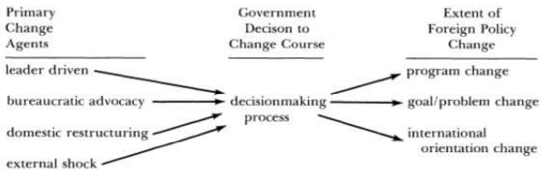
Figura 1: O papel do processo de decisão entre os agentes de mudança primários e os graus de mudança na política externa

Não é necessário que haja sempre a interação entre todos estes vetores, para o autor em comentário. Assim, para que se explique o redirecionamento de uma política exterior, estes podem atuar em conjunto ou um deles pode implicar na incidência subsidiária de outro. É, pois, a partir desta metodologia que se buscará compreender as expressões dos votos brasileiros na Comissão de Política Especial e Descolonização e no Plenário da AGNU e no CSNU. Como forma exemplificativa, o modelo de Hermann demonstrado a partir da seguinte gravura: