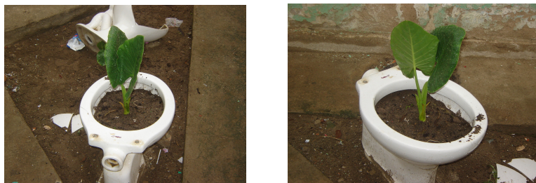
FIGURA 1 – Vasos Sanitários resignificados.

Acreditamos na manutenção da escola como espaço público privilegiado de formação do “indivíduo-para- si”. Mesmo que o “presentismo” e a “sacralização da urgência” estratifiquem o trabalho docente e desviem o “esforço muscular nervoso” desta categoria profissional para planos imediatos, o contexto discursivo escolar revela uma oposição ou resistência à aceitação de práticas e de projetos gerados na hierarquia educacional.